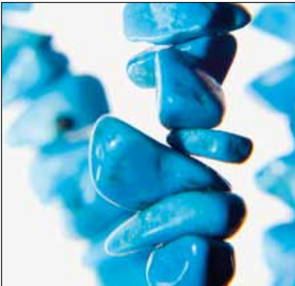
Schmuck und Uhren für CEE