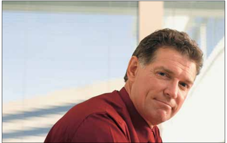
Factoring sorgt für Liquidität und Sie können Skonti optimal nutzen.

Wer jetzt über ausreichend Liquidität verfügt, hat in der angespannten Wirtschaftslage deutliche Wettbewerbsvorteile. Und genau hier greift Factoring. Unternehmer, Banken, Wirtschaftstrehänder, Steuerberater und auch die Wirtschaft haben erkannt, dass Finanzierungsformen wie Factoring eine sinnvolle Ergänzung zur klassischen Betriebsmittelfinanzierung sind. Mit Factoring können Umsatz und Außenstände einfach, günstig und fristenkonform finanziert werden. Es kann sofort über Geld verfügt werden, dass eigentlich erst später zufließen würde. Durch die mit Factoring erreichte finanzielle Beweglich-