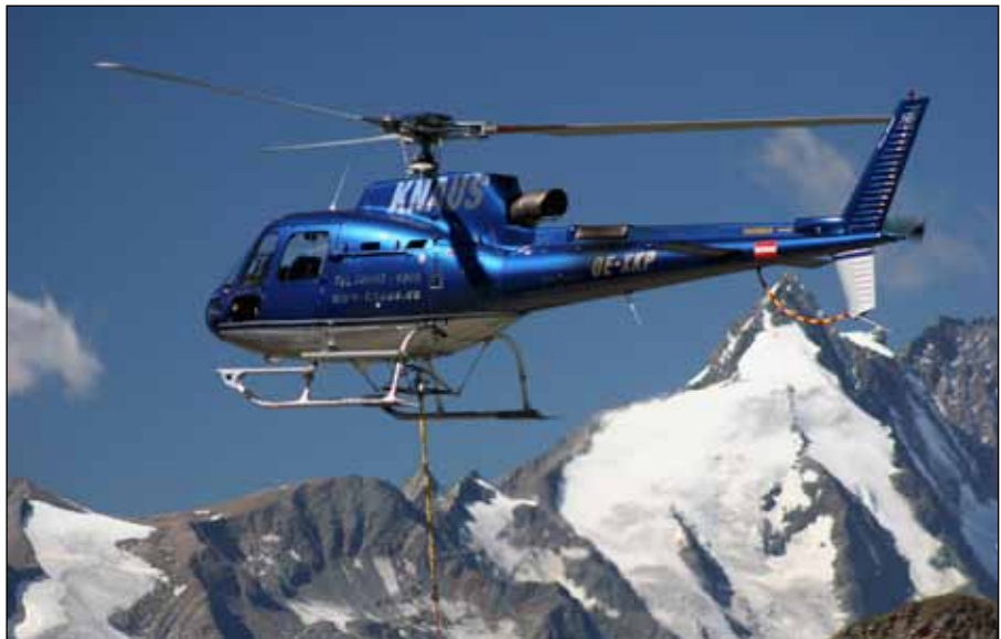
Fliegen im hochalpinen Gebiet zählt zu den Spezialitäten von Heli Austria.

Durch Factoring erzielte Heli Austria eine höhere Liquidität.